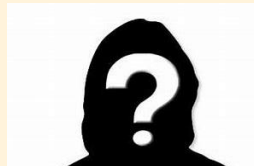
Praktikantin / Unterstützung c. 50%