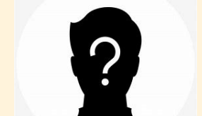
Community Building Erfahrung