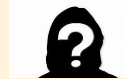
GLTA / IZA Erfahrung