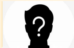
Bildungs- und Öffentlichkeitsarbeit 60-80%